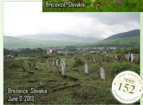
Brezovice, Slovakia June 3, 2013