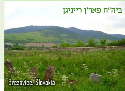
ביה"ח פאר'ן רייניגן