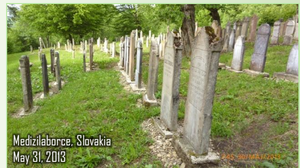
Medzilaborce, Slovakia May 31, 2013